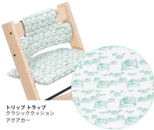
トリップトラップ クラシッククッション アクアカー