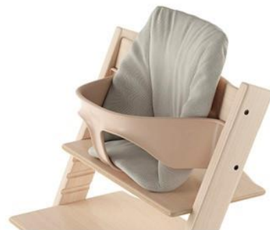
左：スイートハート 右：タイムレスグレー