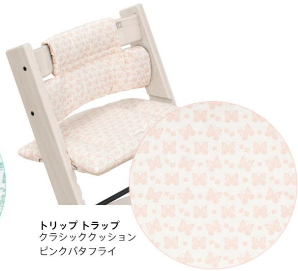
トリップトラップ クラシッククッション ピンクバタフライ