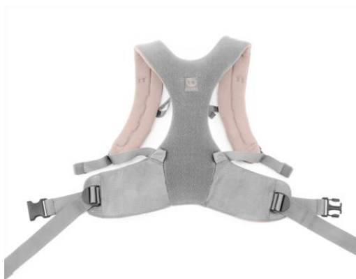
【ペアレントハーネス】