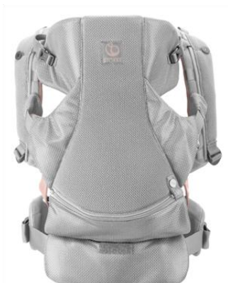
【フロントキャリア】