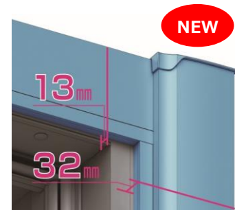
幅 80mm 薄見込 (32mm)