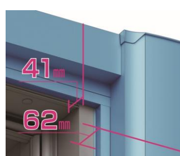
幅 80mm 厚見込 (62mm)