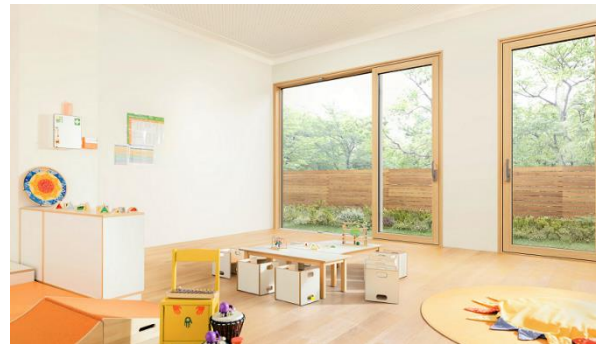
「APW 651」大開口スライディング施工イメージ

脱炭素・カーボンニュートラルの実現に向けた家庭部門における温室効果ガス排出量の削減に向け、YKK AP は「APW」樹脂窓シリーズの発売から 15 年間で開口部の高断熱化を推進してきました。日本の樹脂窓比率はこの 15 年間で伸長を続け、材質別構成比で 22%（※1）となっています。更に、2022 年に住宅性能表示制度（※2）において断熱等性能等級 5・6・7（※3）が新設され、2030 年には断熱等性能等級 5 が義務化予定の日本では今後ますます住宅の高断熱化が進んでいきます。これらの動きに対応するための新しいチャレンジとして、木製窓の開発に取り組まれました。