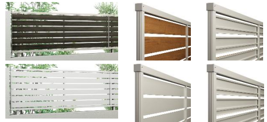
(上) 「ルシアス フェンス」表裏なし YS2H 型、表裏あり YS3F 型

「ルシアス フェンス」「シンプレオ フェンス」両シリーズともに格子を住宅側からのデザイン性も高い表裏なしとコストパフォーマンスの高い表裏ありから選択でき、予算に合わせた提案が可能なデザインを設定しています。