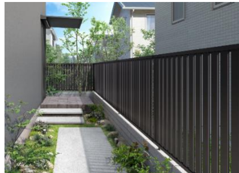
施工イメージ：（左）「ルシアス フェンス」YS3F 型、（右）「シンプルオ フェンス」JTS2 型

ライフスタイルにあわせたおうち時間の充実のため、庭の快適性を高めるフェンスには目隠し効果や防犯性だけでなくデザイン性への要望が高まっています。また大規模地震時のブロック塀の倒壊被害への対策が求められる中、ブロックと比較して軽量のアルミ型材フェンスへのニーズが拡大しています。これらのニーズに対応するべく、商品の提案力強化を図り「ルシアス フェンス」インセットデザイン（※1）、「シンプルオ フェンス」をリニューアルします。