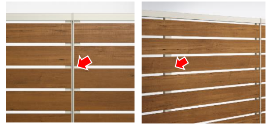
(左) 格子の連続感を高めるスリムなたて枠

「ルシアス フェンス」9 デザイン、「シンプレオ フェンス」17 デザインをリニューアルし、各フェンス新たに 1 デザインを追加。全デザイン共通で上下胴縁がフラット化し、横基調のデザインはスリムなたて枠、中骨の背面配置により、横格子の連続感を高める連結が可能です。