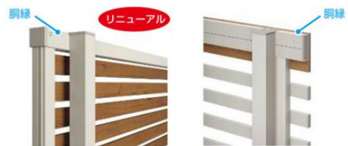
（左）インセットデザイン、（右）アウトセットデザイン