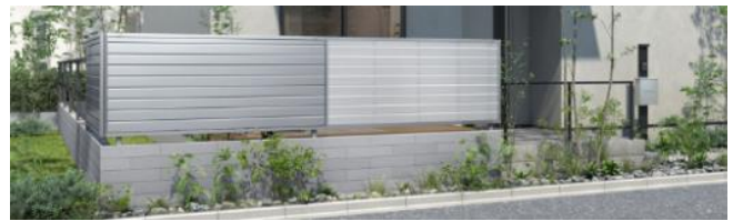
施工イメージ：(左) 横目隠しデザイン×(右) 採光ルーバーデザイン

横目隠し×採光ルーバーと、たてスリット×たて目隠しとのパネル形状を同一化することで、同基調の異なるデザインでも連続感を損なうことなく連結が可能です。