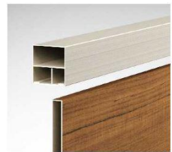
上下胴縁のフラット化

「ルシアス フェンス」は木調や樹脂パネルで建物と外構の美しい調和を目指したシリーズで、「シンプルオ フェンス」はシンプルなデザイン性とコストパフォーマンスを兼ね備えたシリーズです。デザイン性の強化として上下の胴縁形状をフラット化し、格子の連続感を高めるスリムなたて枠等により空間に調和するノイズレスなディテールへ刷新します。