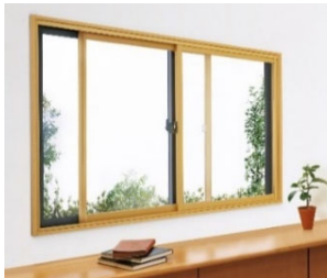
「マドリモ 内窓 プラマード U」

「ドアリモ 断熱ドア D30」（戸建用） https://www.ykkap.co.jp/consumer/products/door/doorremo-door_d30