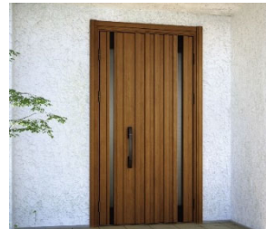
「ドアリモ 断熱ドア D30」 （戸建用）