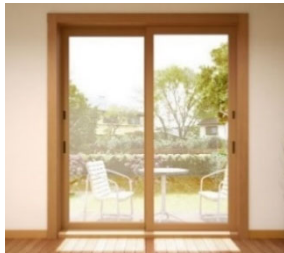
「マドリモ 断熱窓 戸建用」