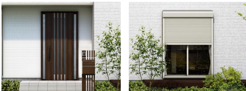
対象商品：スマートドア（左）、リモコンシャッター（右）

YKK AP は、商品の設置後もより長く安心して使用いただける制度の整備により、スマートドア、リモコンシャッターの市場の拡大を目指すとともに、快適な住まいづくりの実現に努めています。