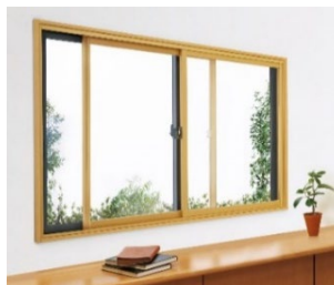
「マドリモ 内窓 プラマードU」

「ドアリモ 断熱ドア D30」（戸建用） https://www.ykkap.co.jp/consumer/products/door/doorremo-door_d30