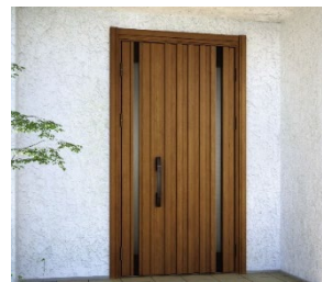
「ドアリモ 断熱ドア D30」（戸建用）

※窓種や詳細ガラス種やデザインや枠バリエーションなどにより、該当しない場合もありますので、ご了承ください。