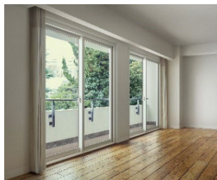
「マドリモ 断熱窓 マンション用」