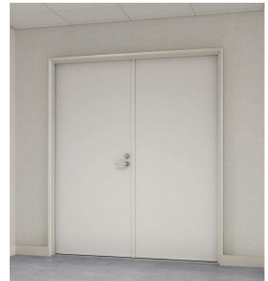
機械室・倉庫 使用例

YKK AP では集合住宅向けとして、窓、玄関ドア（「EXIMA 80St」「R's SDX」）の他、パイプシャフトドア「ガスチャンバードア・点検口」や、管理人室など屋内で使用される「鋼製軽量ドア DL」を展開してきました。