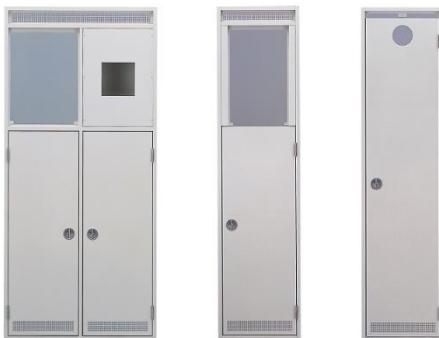
ガスチャンバードア

美観と使いやすさを考慮した、ガスチャンバードア（集合住宅の解放廊下に面したパイプシャフト部に取り付ける扉）と、点検口（設置機器部に取り付ける扉）です。