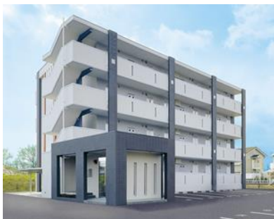
低階層集合住宅 イメージ

この度、階段室、機械室、倉庫、通用口などで使用される重量ドア「鋼製重量ドア DH」を新たにラインアップ。これにより、低階層集合住宅に対し、住戸部の窓・玄関ドアに加え共有部の重量ドア・軽量ドア商品も合わせて、物件1棟 YKK AP 商品での提案が可能になります。窓・ドアを一括発注いただく事により、工程管理や現場荷受けの負担の軽減につながります。