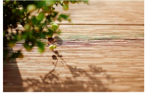
天然木のような深い陰影感を再現

アカシアやチークなどに代表される硬質で強度が高い広葉樹の「硬木」をモチーフに、木目が真っ直ぐに伸びる「柂目柄」の緻密で美しい木肌を再現。硬木は耐久性に優れ、柂目柄は模様が均一のため建築化粧材や高級家具などに使われます。本物らしい質感を追求するため、表面に凹凸柄を付加し、上からサンディング（研磨）する独自の加工により、天然木のようなランダムな溝で深い陰影感を再現しています。