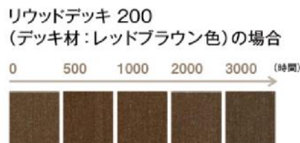
天然木に比べて変色が少ない (弊社 促進耐候性試験より)