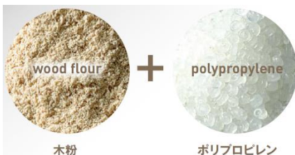
原料に硬度の高いポリプロピレンを使用

「リウッドデッキ 200」同様に硬度の高いポリプロピレン（※1）を原料とし、高い耐久性（耐候性・耐腐朽性・耐水性）を実現。天然木に比べて強度の低下や変色が少なく長い期間美しさを保ちます。継ぎ目部分は独自のサネ構造（つなぎ目）を採用し、目地（継ぎ目）は 3 mm幅で、カードなどが目地に入っても下に落ちない構造です。デッキ材のピッチ幅は 200 mmで関東間とメーターモジュールの納まりに適した仕様になっています。