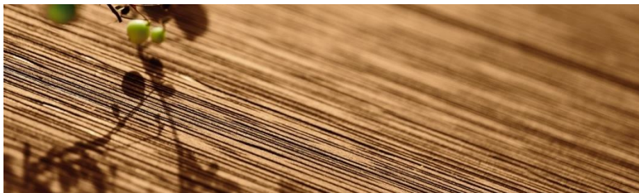
高級家具に使用される硬木調の木肌を再現

ライフスタイルの変化により増加するおうち時間を充実させるため、庭やテラス、バルコニーなど屋外の快適性、デザイン性を高めるエクステリア商品への関心が高まっています。くつろぎのプライベート空間を創り出すウッドデッキにはこだわりの庭空間へのふさわしい質感が求められる一方、メンテナンスの手間を減らしたいという“デザイン”と“耐久性”の両方を満たす商品へのニーズが高まっていました。そこで YKK AP では既存のデッキ商品「リウッドデッキ 200」の耐久性や硬度などの性能に加え、天然木の質感と木目柄を再現した「リウッドデッキ 200 EG」を発売します。EGは商品の特長である緻密で真っ直ぐ、伸びやかな木目柄“Edge Grain（柾目）”を表しています。