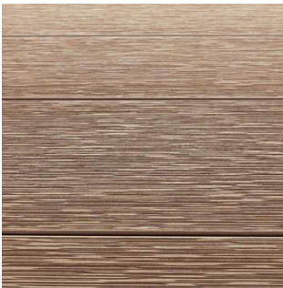
柄を直角に照らす光

硬木調の柂目柄が生み出すランダムで深い溝が光の当たり方や眺める角度によってさまざまな木目の表情を演出します。同じ時間でも柄を直角に照らす光は溝が深く色が濃く見え、並行に照らす光では溝が浅く色が薄く見えます。昼と夜でもナチュラルにもシックにも変化し、おうち時間を充実させる庭空間を演出します。