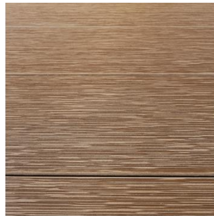
柄を並行に照らす光