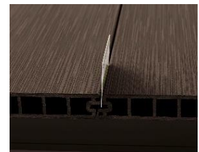
継ぎ目部分でモノが落ちない構造