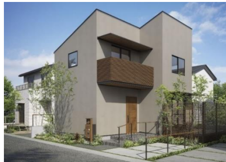
「ルシアス バイザー」施工イメージ（左：2階窓上、1階玄関上～テラス窓上、右：2階バルコニー上、1階テラス窓上）

ひさしは、真夏の強い日射を効果的に外部で遮る“日よけ”、窓ガラスの汚れを軽減し雨や雪を防ぐ“雨よけ”に効果があるだけでなく、住宅外観に陰影をもたらし、彫の深さを表現できる“外観アクセント”にもなります。また、「ルシアス バイザー」は日よけ商品の「アウターシェード」を付ける事もできるため、窓に差し込む西陽やデッキ空間の日射遮蔽にも活用でき、バルコニーやテラスに新たなくつろぎ空間を創出できます。