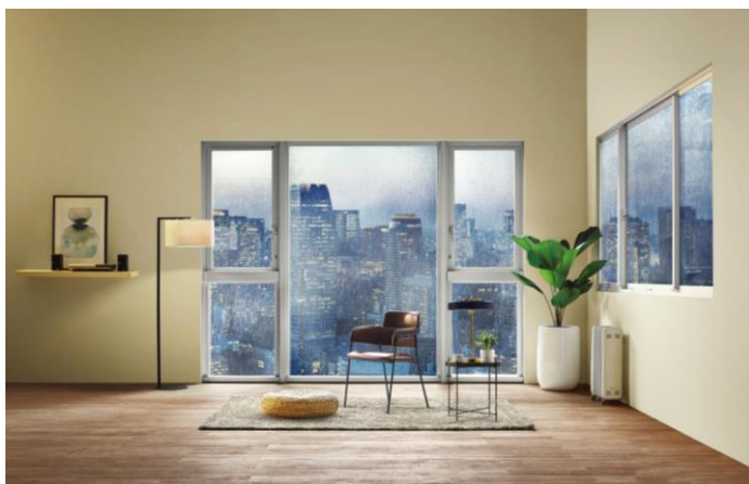
【台湾で高い評価を獲得している高水密サッシ「YRB-A」】

YKK APは、1989年に台湾で事業を開始して以来、台湾の気象条件に合わせた高水密サッシ・カーテンウォールを製造し高い評価をいただいております。主力の高水密サッシ「YRB-A」を基幹商品とし、近年では、高い意匠性を持つ非居住向け隠しフレームサッシ「PROSYS100」の投入や、住宅販売の7~8割を占める中古市場向け改装専用枠を開発するなど、より一層お客様の要望に応える商品とサービスの提供に努めています。