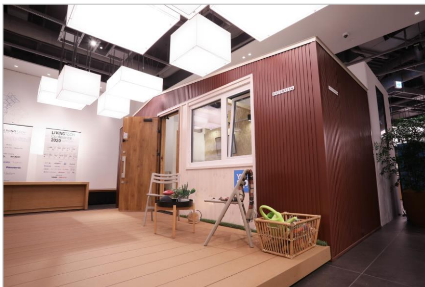
〈展示品外観の様子〉

<サイト： https://store.tsite.jp/futakotamagawa/event/shop/16710-1140491026.html >