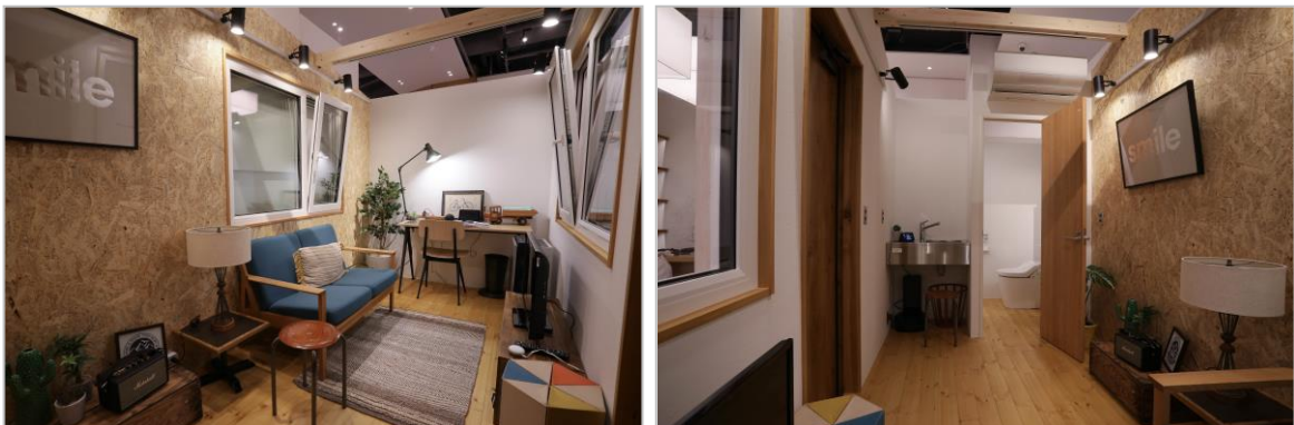
〈展示品内観の様子〉

なお、今回の展示は、リビングテック協会の主催する「LIVING TECH Conference 2020 暮らしとテクノロジー展」の実証実験プロジェクト第1号でもあり、with コロナ時代におけるテクノロジーと暮らしの融合で住まい方の選択肢を模索していきます。