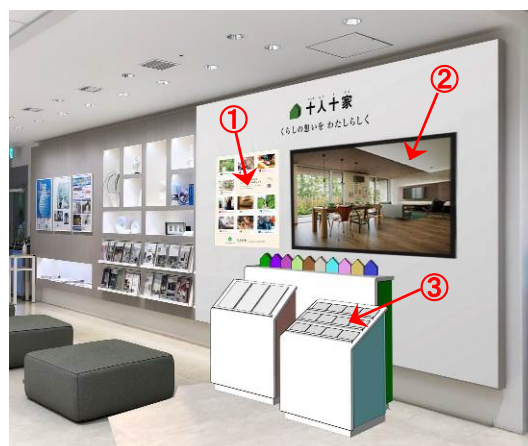
“十人十家”コーナー 展示イメージ

③表面に空間画像、裏面にプランのポイントを紹介した10種のポストカードをご用意。プラン詳細ページの2次元コードを掲載していますので、気になるプランのポストカードを持ち帰り、ご自宅からも確認いただけます。