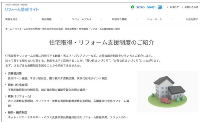
(上)住宅取得・リフォーム支援制度紹介ページ