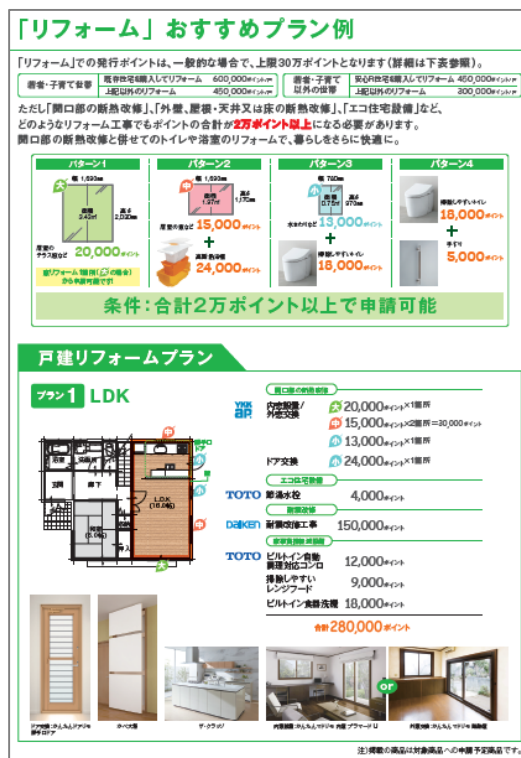
「次世代住宅ポイント制度活用ガイド」の解説ページ例

TDYでは、税制や補助・融資といった支援制度の認知を広げ、その制度をご活用いただくことで、お客様の理想の住まいづくりに貢献できると考えています。引き続き、対象商品の提案を含め、情報発信をすすめていきます。