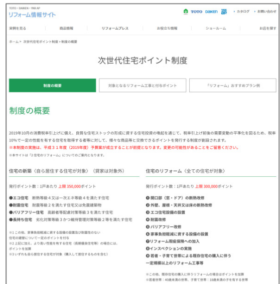
(右)次世代住宅ポイント制度紹介ページ