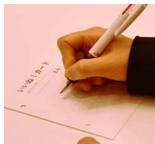
全員が「いいね！カード」記入