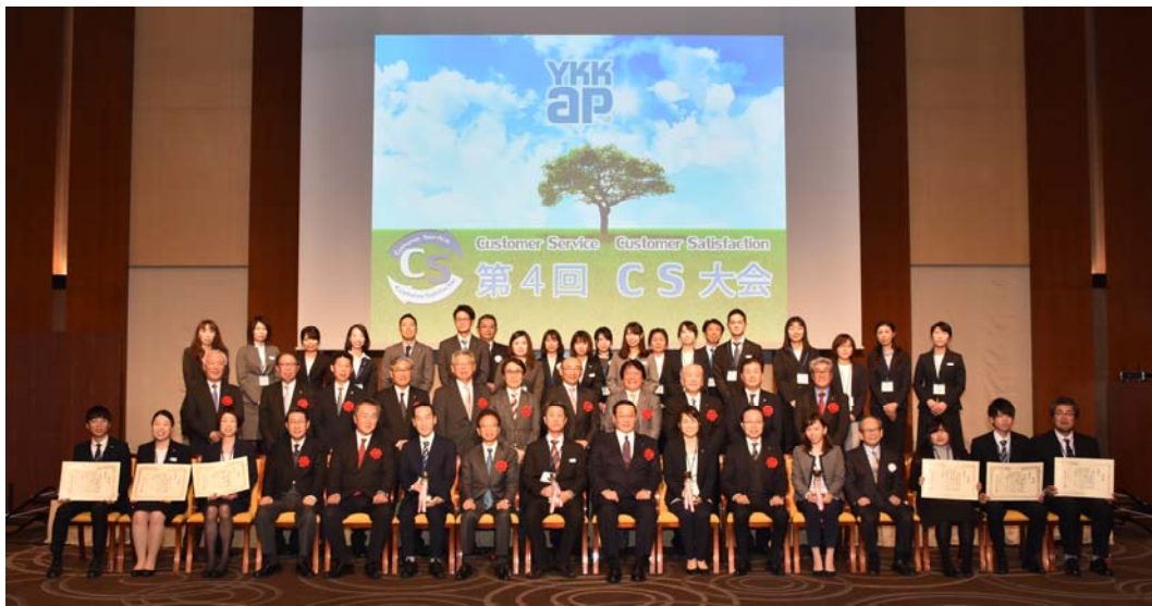
参加者全員の記念写真

大会実行委員長である弊社社長は、「 お客様のご満足を実感できる仕事は、“働きがい”につながる。これからも、お客様のことを考えて行動できる人にスポットライトをあてていきたい。 」と挨拶し、お客様に選ばれ続ける企業であるためのCSの重要性を再認識する機会となりました。