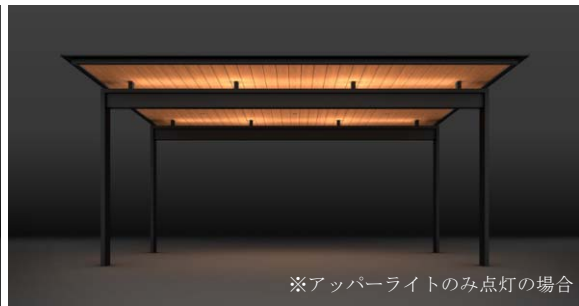
アップライト 東構造を活かした演出光が、屋根を浮かび上がらせる ※アップライトのみ点灯の場合