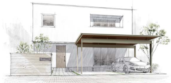
積雪 30 cm/ダウンライト付き/木調色軒天 幅 6300 mm×奥行 5100 mm×高さ 2825 mm