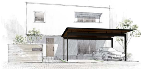
積雪 30 cm/ダウンライト付き/木調色軒天 幅 6300 mm×奥行 5100 mm×高さ 2825 mm

厚みを感じさせない柱の見付、シャープさを強調した呼び樋、そして屋根に浮遊感をもたらす束など、住宅と美しく一体化するために、一つひとつの部材にこだわりました。上質な屋根空間を生み出す「エクスティアラ ルーフ」は、従来の屋根商品と一線を画す仕上げになっています。