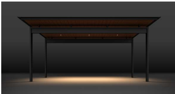
ダウンライト 軒天から屋根下空間を照らす

天井や梁に設置するダウンライト、美しい木調の天井を強調するアップライト。構造を生かした照明が、空間をドラマチックに演出し、利用者や街ゆく人々の日常に彩りを加えます。