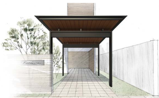
Situation 1 共用エントランスへのアプローチに使用

戸建住宅でも集合住宅でも店舗でも。建物デザインに調和するように設計された「エクスティアラ ルーフ」が、さまざまなプランニングに柔軟に対応します。