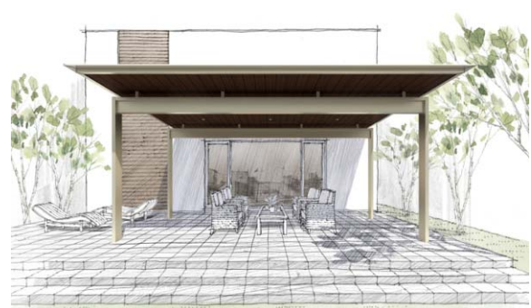
Situation 2 リビングからつながる快適な屋外空間を提案