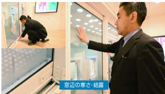
断熱性・防露性（結露）