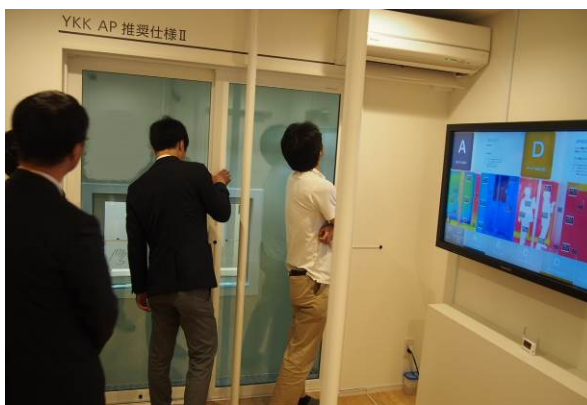
断熱効果の体感ROOMで体感中の様子

※1：外皮とは、住宅の外側をつつむ外壁、屋根・天井、床、窓・玄関を指し、その性能を強化すること。