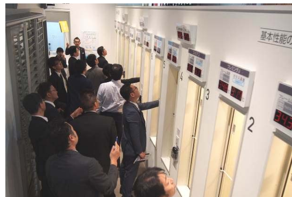
窓による遮熱性能の違いを体感中の様子