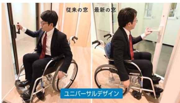
使いやすさ（操作性）