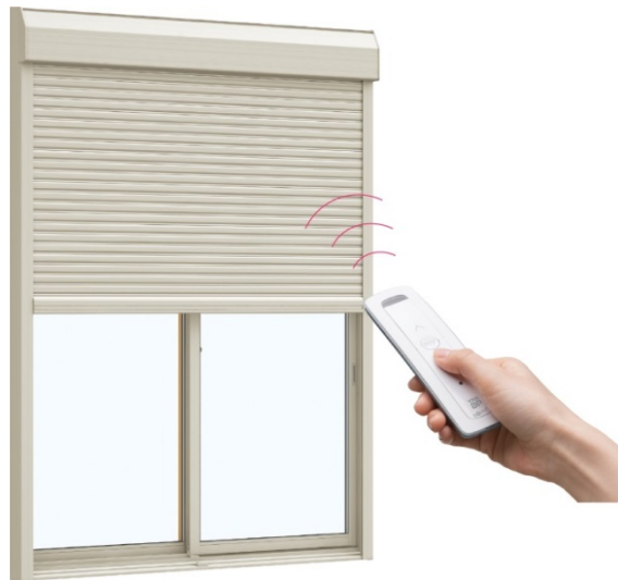
（実際は室内でのリモコン操作です。）