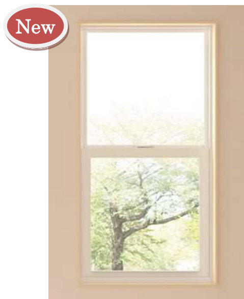
[耐熱強化複層ガラス（透明）]