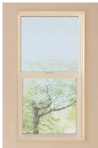
[従来品：網入複層ガラス（透明）]