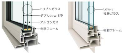
高性能トリプルガラス樹脂窓