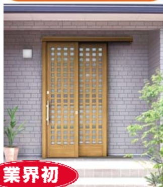
アウトセット玄関引戸