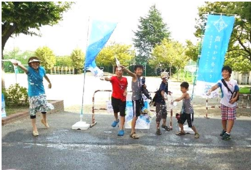
(「MADOショップ蟹江学戸店」での打ち水イベント風景)

夏場の快適な窓辺の過ごし方の“先人の知恵”である「打ち水」。窓から入る風の温度が下がります。各地のMADOショップで打ち水イベントを同日開催し、地域の方々へ熱中症予防への声かけを実施しました。特に、優秀賞を受賞したMADOショップ蟹江学戸店では、小さいお子さんからお年寄りまで参加できるよう、ペットボトルに水を入れて打ち水を実施。店舗近隣の地域10ヶ所で打ち水を実施した点が評価されました。