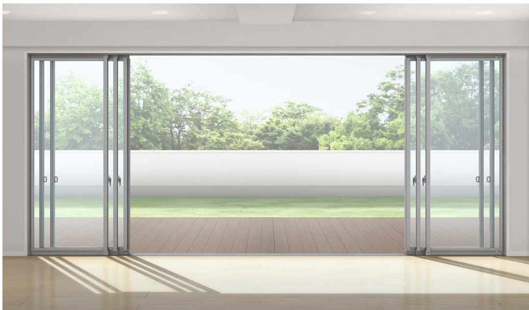
「EXIMA31」引違い窓6枚建 レールフラット下枠仕様 施工イメージ

「EXIMA31」引違い窓6枚建は、ビル用ウインドウ商品として業界初となる商品設定となります。従来では出来なかった大きな有効開口を実現し、風や光を存分に採り入れた開放感を演出できます。広い開口が確保されることから車椅子の通行にも適しており、大勢が出入りする開口部としても最適です。同じサイズの開口部に“4枚建”を使用した場合と比較し、“6枚建”は窓を全開したときの有効開口が約20%アップ。更に、複層ガラス仕様もラインアップし、断熱性に優れた室内空間を実現します。教育施設、医療福祉施設、集合住宅などへ明るく快適な空間を提案します。