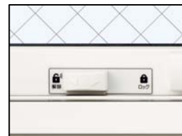
サブロック (すべり出し窓)