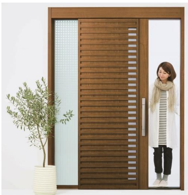
断熱スライディングドア「NEWコンコード」 (W03 デザイン)