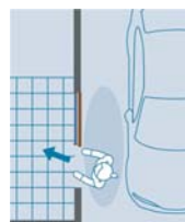
ガレージ内の玄関も 出入りがラク