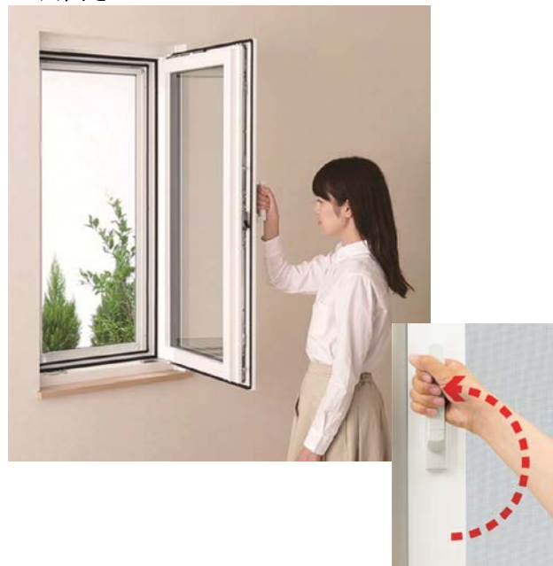
ハンドルを180° 上まで回して開く