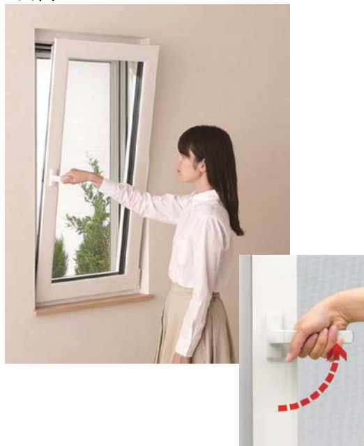
ハンドルを 90°回して開く