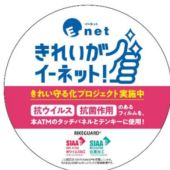
「きれい守る化プロジェクト」実施済みATMに添付するステッカー（イメージ）

清掃作業後に、リケンテクノス株式会社の「リケガード」を、テンキーおよびタッチパネル画面の2カ所に貼付し、ATMのきれいで安心な状態を守ります。さらにリケガード貼付後もきれいなイーネットATMを維持するべく、清掃作業とキッコーマンバイオケミファ株式会社が提供する衛生状態モニタリングシステム運用による清浄結果の測定を継続してまいります。