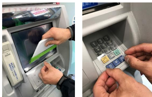
SIAA 認証抗ウイルス・抗菌フィルム「リケガード」貼付の様子