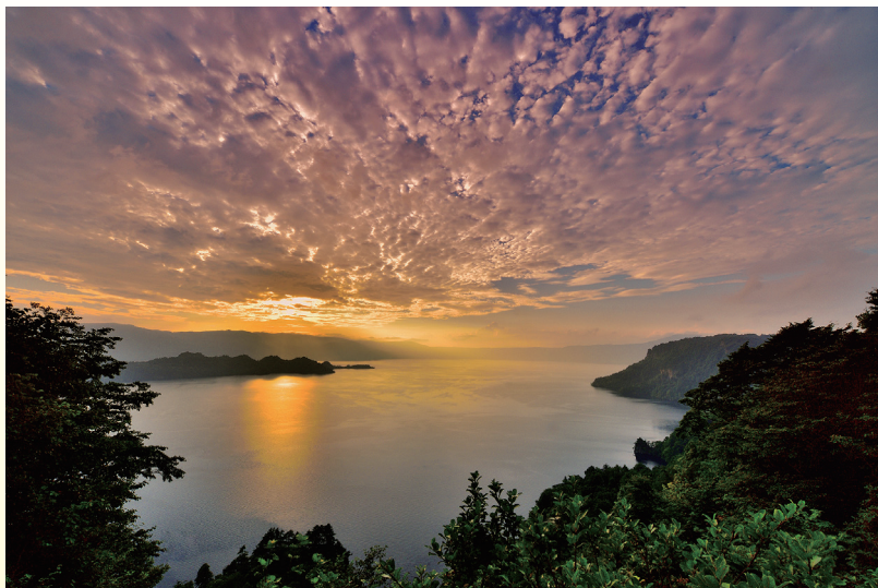
第34回 環境大臣賞 「夕映の十和田湖」 通駅隆英