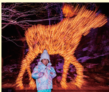
第34回 和田光弘賞 「巨大ヘラジカ現る」 風穴一男