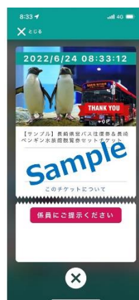
購入後は係員に電子チケットの画面を提示ください