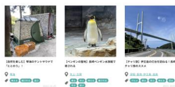
YouTuber 品川正之介氏の観光情報記事