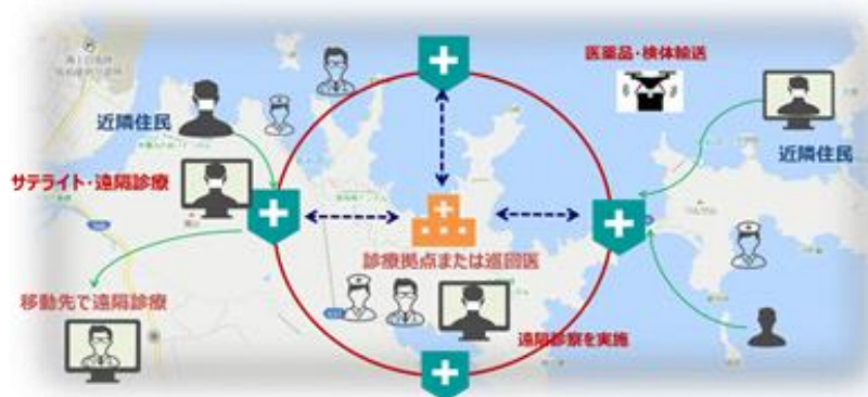
オンライン診療・服薬指導、ドローン配送 実証実験イメージ図