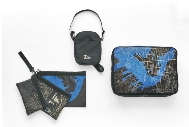
▲(左より)「3 連ポーチ」「2WAYトート&ショルダーバッグ」「衣類ポーチ」