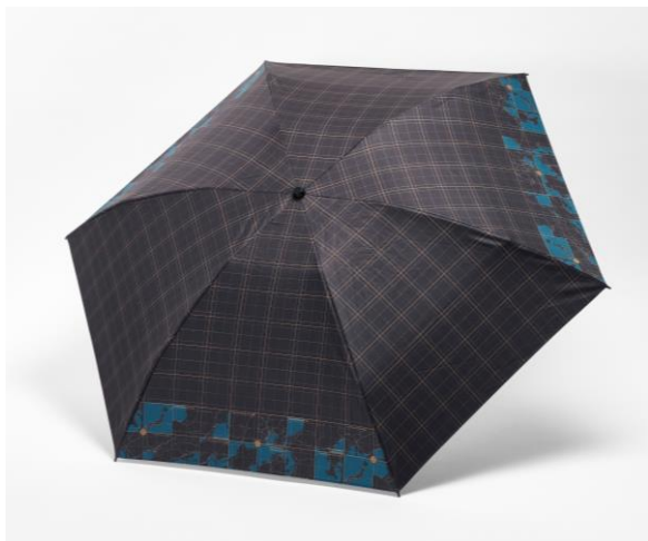
▲晴雨兼用折りたたみ傘

株式会社ゼンリン(本社:福岡県北九州市、代表取締役社長:高山善司、以下ゼンリン)は、地図がデザインされた文具や雑貨を販売する当社ブランド「Map Design GALLERY」の新商品として、夏のお出かけシーズンにぴったりの新アイテムを、Map Design GALLERYオンラインストアおよび各店舗にて販売開始します。今回、新アイテムの中からメンズ向けデザインの「晴雨兼用折りたたみ傘」「2WAYトート&ショルダーバッグ」「衣類ポーチ」「3連ポーチ」を紹介합니다。