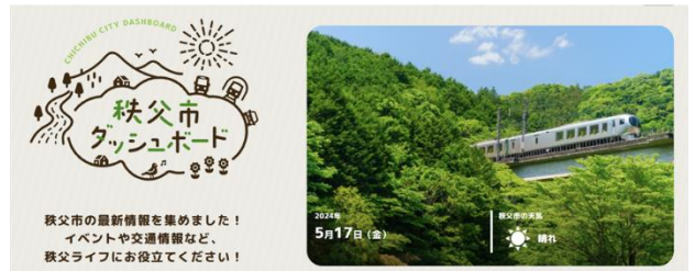
下:秩父市ダッシュボードシステム(WEB サイトトップ画面)