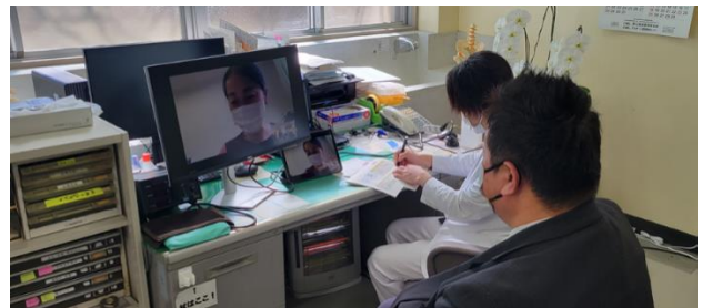
上:遠隔診療のイメージ(オンライン栄養指導の様子)