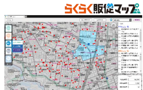
▲中小個店の販促活動を支援する「らくらく販促マップ」

地場企業の振興に向け、企業における業務のデジタル化、効率化を実現するためにITツールの導入支援を推進します。初期の取り組みとして、地元企業における販売支援活動をサポートするため、販促支援等のセミナーの開催やITツールの利用支援を行います。