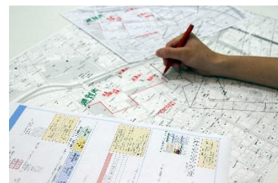
▲地図と地図情報を組み合わせ 有事の際に活用できる施策を検討

地図情報を活用した市民向け啓発活動の実施や、防災・減災に寄与する地図情報の活用施策を検討・実施し、地域における防災力向上を支援します。