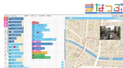
▲地図上でプログラミング学習ができるサービス 「まなっぶ School Edition」

デジタル地図を活用した「プログラミング学習ツール」で学習現場の支援を実施します。また、「防災」「郷土」などのテーマにおける教育活動の推進を支援します。