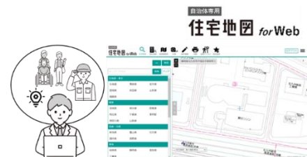
▲地図で情報を管理・可視化し、業務運営の効率化を支援

大村市庁内における資料作成、問合せ対応、訪問準備などの業務効率化を実現するため、地図情報を活用したデジタルツールの利用推進を進めるとともに、庁内外における効率的な行政業務の運営を目指します。