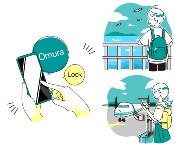
▲地域に人が訪れ、周遊する仕組みを提供する観光型マイクロMaaS

大村市が持つ地形・歴史・文化をつなぐことで、ストーリー型周遊ルートやマイクロエリア間をつなぐサービスチケット等を、Webサイト・スマートフォンアプリを介して提供することで、大村市内周遊の楽しさ、便利さを定着させ、大村市に人を呼び込み、観光周遊を促進することを目指します。