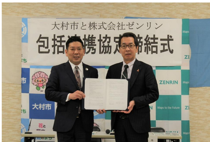
包括連携協定 締結の様子

本協定により、両者が保有する資源の活用を図りながら、幅広い分野で相互に連携・協力するとともに、地図情報を活用した大村市の地域課題解決に取り組み、地域の活性化に寄与することを目指します。