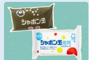
▲過去の「シャボン玉浴用」個包装デザイン