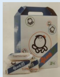
▲1975年当時のシャボン玉浴用の前身「シャボン玉 95」(固形石けん)のパッケージ