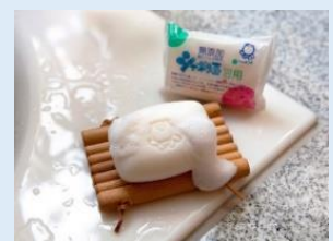
▲現在の「シャボン玉浴用」