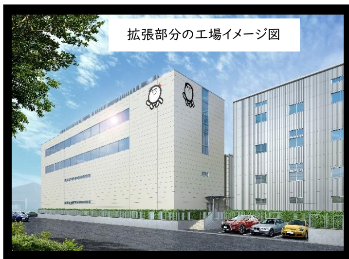
拡張部分の工場イメージ図

シャボン玉石けんの成長戦略の一つである「事業基盤の進化・強化」に向けて、2022年から取り組んでいるスマートファクトリー化と合わせ、2024年からは事務所跡地への工場拡張・製造ラインの設備増強を行い、2026年完成を目途に生産能力の拡大に着手いたします。