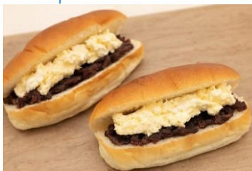
〈銀座木村家〉あんバターコッペ

コロナ禍で活気が減った銀座の街を元気づけようと、期間限定で登場。銀座木村家の酒種コッペパンに各店自慢の逸品を挟んだ商品を開発しました。銀座の名店たちの思いが繋がって実現した夢のコラボレーション企画です。