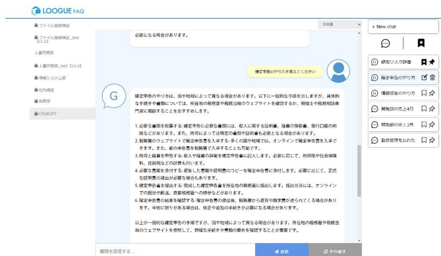
図：AIチャットボットLOOGUE FAQへのChatGPT連携機能イメージ

ARIは、2016年より提供している自社開発のバックオフィス向けAIチャットボットサービス「LOOGUE FAQ(ログ・エフエーキュー)」や、AI自然言語処理を活用した社内ファイル検索サービス「LOOGUE deepdoc(ログ・ディープドック)」を通して、自然言語処理技術を蓄積してまいりました。これらのサービス開発で得た技術情報やノウハウ、および業務自動化支援で培った知見をもとに、各生成AIの特徴を生かしながら日々アップデートされる最新情報を反映し、企業の個別ニーズに対応できる支援サービスの提供を行うことといたしました。