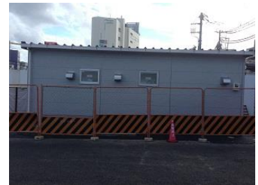
下北沢駅北口の大型仮設トイレ