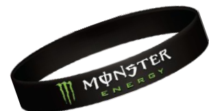
シリコンリストバンド