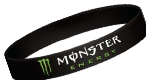
シリコンリストバンド