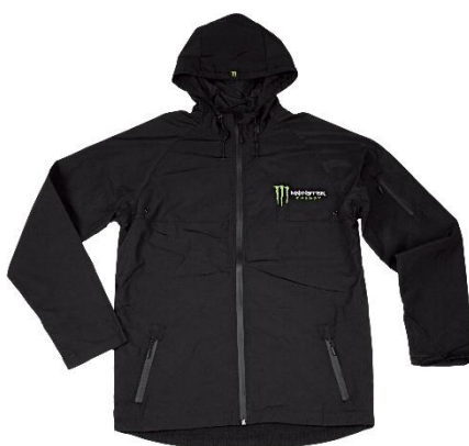
ナイロンジャケット