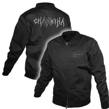
ちゃんみな 限定スタジアムジャケット