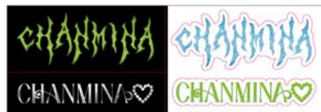
ちゃんみな 限定ステッカー（1種）