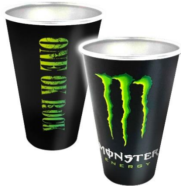
コラボタンブラー