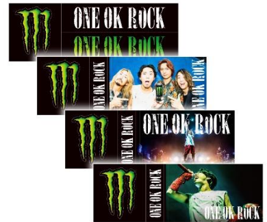
ステッカーシート