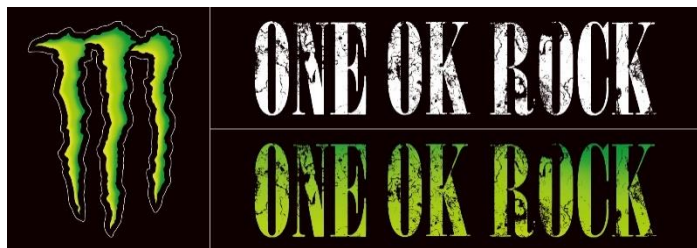
コラボステッカー