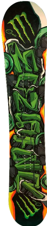
モンスターエナジースノーボード

当選通知方法 : キャンペーン期間終了後、当選者の方へモンスターエナジージャパン公式Twitterアカウントより、 ツイッターのダイレクトメッセージをお送りいたします。 ※モンスターエナジージャパン公式アカウントをフォローしていないと、 ダイレクトメッセージが送れません。必ずフォローしてください。