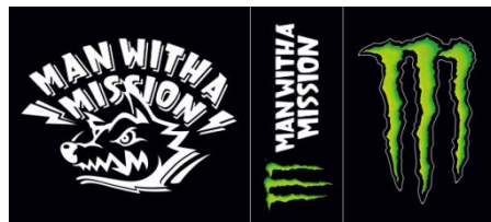
【コラボステッカー】