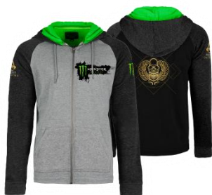
【第1弾】 コラボパーカー

賞品 : 【第1弾】 対象ツイート：9月21日 (木) モンスターエナジー × 「アサシン クリード オリジンズ」 コラボパーカー …… 100名 【第2弾】 対象ツイート：10月6日 (金) モンスターエナジー5ケース …… 100名 【第3弾】 対象ツイート：10月16日 (月) モンスターエナジー × 「アサシン クリード オリジンズ」 コラボ冷蔵庫 …… 10名