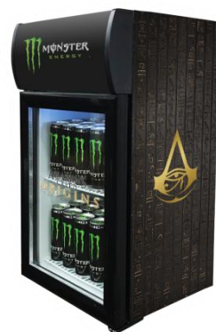
【第3弾】 コラボ冷蔵庫