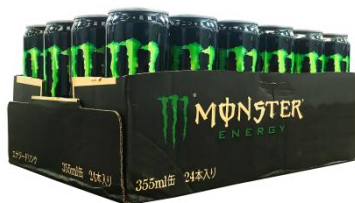
【第2弾】 モンスターエナジー5ケース