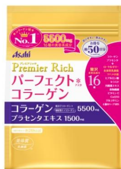
約 50 日分