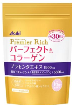
約 30 日分