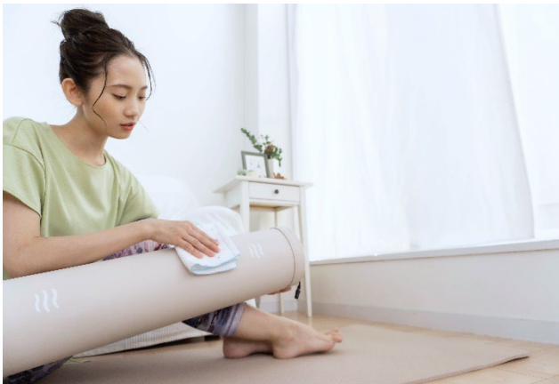
お手入れ方法のイメージ

「FRP90」の芯材に採用している発泡ポリプロピレン(EPP)は、耐久性に優れ適度な硬さで体をしっかりと支えます。本体カバーはしっとりとした触り心地の良いPVC素材で、気になる汗や汚れをさっと拭き取るだけで簡単にお手入れができます。カラーは落ち着いたアイボリー色で、そのまま置いておいてもお部屋に馴染みます。