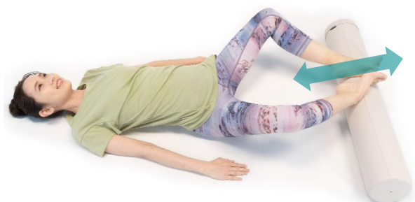
股関節をケアする際のポージング