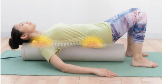
ヒーター部と基本的な姿勢