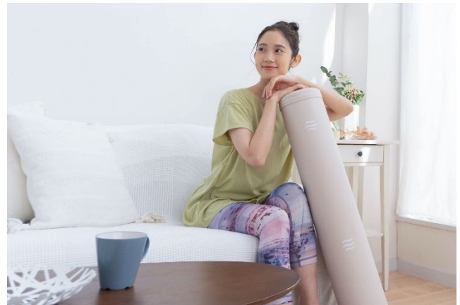
インテリアにマッチするアイボリーカラー