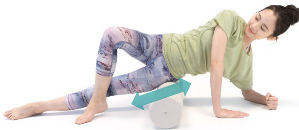
ももをケアする際のポージング

「FRP90」を様々なポージングで使用することで、肩・肩甲骨・腕・背中・腰・もも・股関節など、気になる部位の筋肉や関節をケアすることができます。