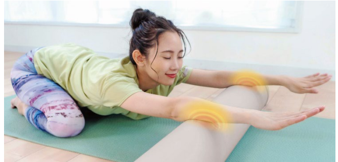
ヒーター部を活用した使い方(腕)