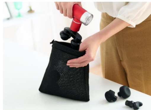
持ち運びに便利な巾着ポーチ付