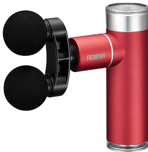
マッスルショットプレミアム FG3800P

美と健康の総合メーカー、株式会社フジ医療器(本社:大阪府中央区)は、独自開発のツインアタッチメントで全身の筋肉をパワフルにケアするハンディタイプのリラクゼーションアイテム「マッスルショットプレミアム FG3800P」(以下、FG3800P)を2023年4月14日に発売いたします。