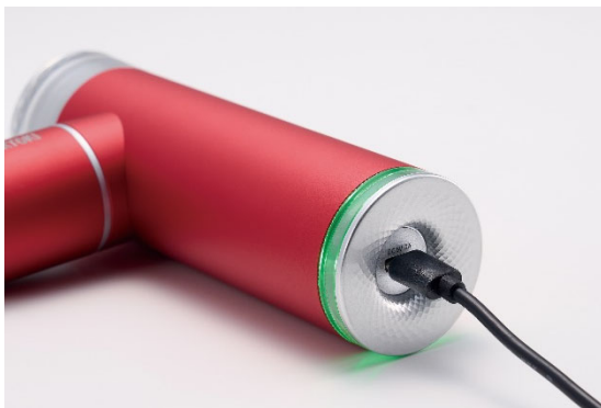
充電式でどこでもボディケア

充電式で電池持続時間は最大約5時間の2,200mAhリチウムイオン電池を搭載しています。また本体とアタッチメントが入る専用巾着ポーチを付属しているため、出張や旅行先など移動の際の持ち運びにも便利です。