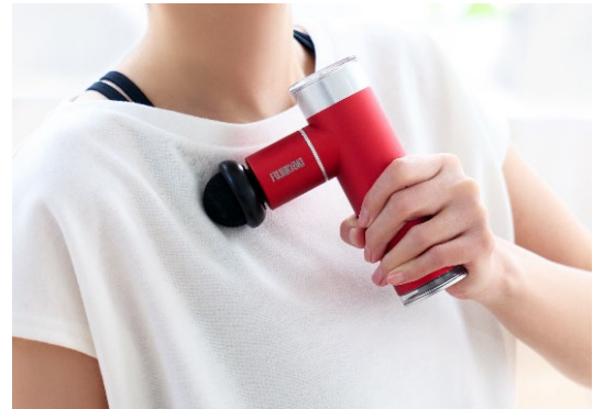
1個のアタッチメントでのケア