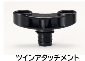
ツインアタッチメント